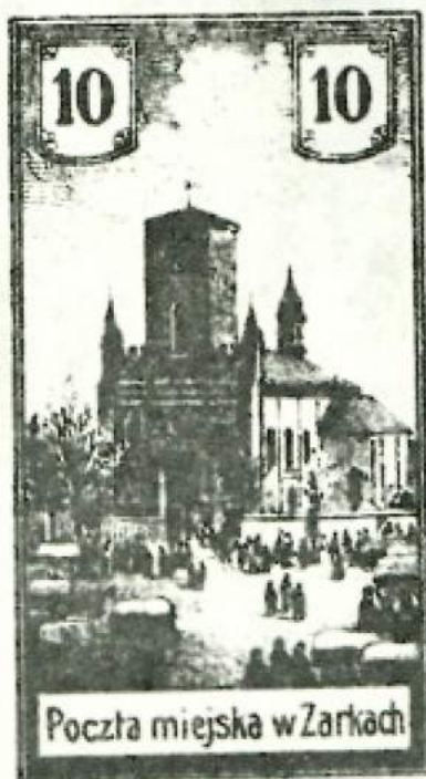
Czworoblok Poczty Miejskiej Żarki. Dar Alleji Horakówny.